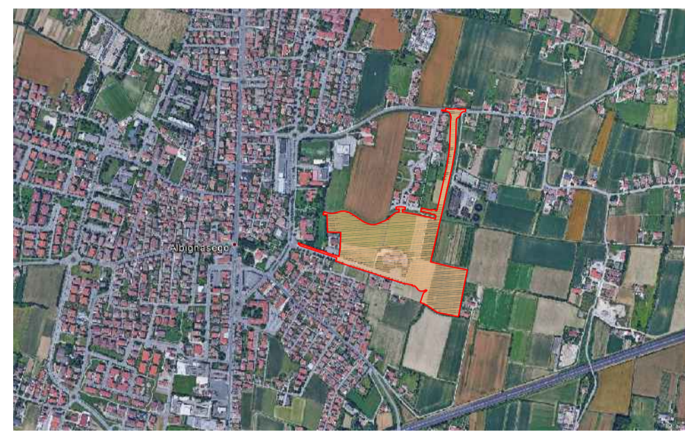
PIANO PARTICOLAREGGIATO "San Lorenzo" Legge Regionale 23 Aprile 2004 n. 11 "Norme per il governo del territorio"

AMPLIAMENTO AMBITO DI INTERVENTO MEDIANTE ACCORDO PUBBLICO-PRIVATO AI SENSI DELL'ART. 6 DELLA L.R. 11/2004 IN VARIANTE AL P.A.T. ED AL P.I.